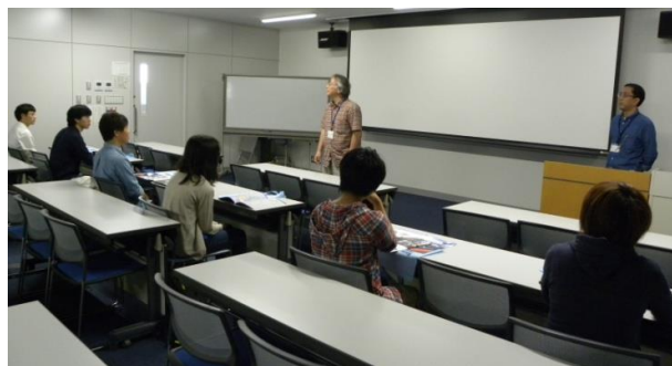
センター紹介@セミナー室