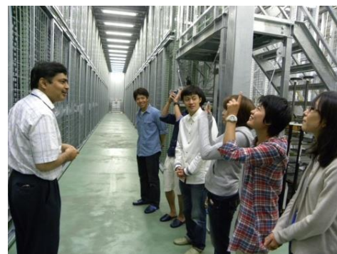
IODP コアの紹介@B 棟 IODP コア保管庫