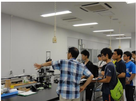
非破壊計測器の説明@コアロギング室