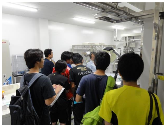
液体窒素凍結システムの説明 @新棟サンプリング室