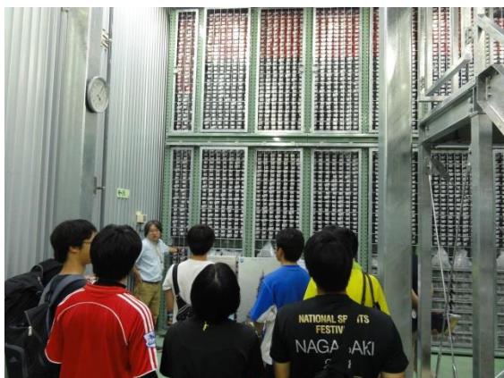
IODP コアの説明@新棟コア冷蔵保管庫