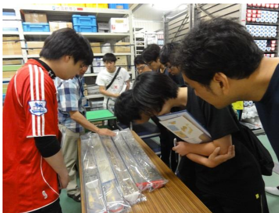
海洋コアの観察@第1コア冷蔵保管庫