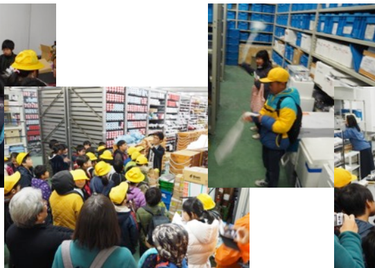
冷蔵&冷凍コア保管庫 (-20℃体験)