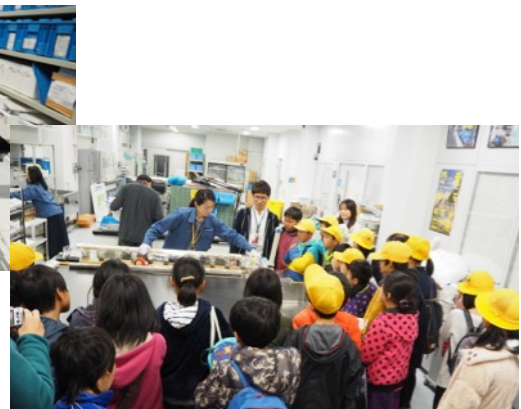
コア試料のサンプリング見学