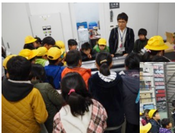
海洋コア 5 試料