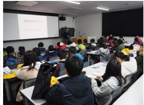
役に立つことと立たないこと@セミナー室