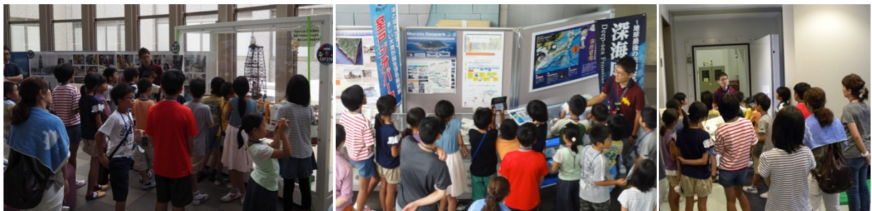
館内ツアーの様子